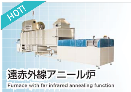
遠赤外線アニール炉

Furnace with far infrared annealing function