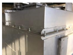
▲耐熱のシルバークラウドのみが塗られた状態(施工前)