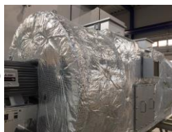
▲炉全体を断熱材で覆った状態。見た目にもきれいに蘇ります