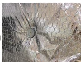
▲厚さ25mmの断熱材(ロックウール)をピンとネットを使って固定します