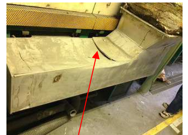
ダクト鋼板が熱の為に変形 熱風漏れ発生!

乾燥炉をご使用のお客様から「炉から煙が出ている」との連絡を受け緊急で現地に出動しました。煙の原因は熱による経年劣化でダクトが破裂し、保温材を過熱していた事によるものでした。ダクトの途中から煙が上がっているとお客様が早目に気づいてくれたので大事に至らずに済みました。普段よりも設備の立上げ時間が掛かり過ぎていた為、炉周りをチェックしたところ煙に気付いたそうです。装置側にも安全装置は取り付けられていたましたが、それだけでは判らない部分の日常点検・管理が大事だと感じさせられる出来事でした。少しでも気になる事がありましたらお早目にご相談下さい。早期発見・早期修理が重要です。