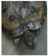
我が家のペット 名前は亀二

こんにちは！ 設計部です。今年で入社3年目です。業務内容は製作図、3DCAD のモデル、及び電気図面の作成等です。我が家の家族を紹介させていただきます。写真のみどり亀です。彼(?)との出会いは10数年前ですが、初めは10cmにも満たなかったのに今では30cmに手が届く程になっています。亀は万年と言いますが、ガメラ級になるにはあと何年お世話をすればいいのでしょうか？ 玄関の小さい水槽の中で飼っているのが窮屈な想いをさせてしまっていますが、毎日水槽の中を元気に動き回っています。先日頑張っって水槽から出ようとして遂に水槽をひっくり返し玄関を水浸しにしてくれました。片付けは大変でしたが、動き回っている姿を見るとつい微笑ましく思えてしまいます。早くガメラになればよ...それでは今月の熱技術ニューススタートです。