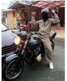
愛車でちょっと買い物へ→

皆さんこんにちは！入社6年目営業部です。入社後は製造部に5年所属し、昨年からは営業部に籍を移し、日々新しい事にチャレンジしています。私の趣味はバイクで休日には友人達といろんな場所へツーリングに行きます。様々な景色を見ながら風を切って走るのとはとても気持ちの良いものです。数年前まではただ運転しているのが楽しくて、景色のうつろいに目を向ける事があまりなかったのですが、最近では紅葉や青々しい緑に癒されます。いまの時期は寒さが身に堪えるのでお休み中ですが、また暖かくなってきたら仲間と遠方へのツーリングに行こうと考えています。これからも安全運転で楽しみます！！それでは今月の熱技術ニューススタートです。