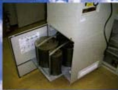
活性炭カートリッジ