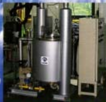
活性炭脱着再生装置